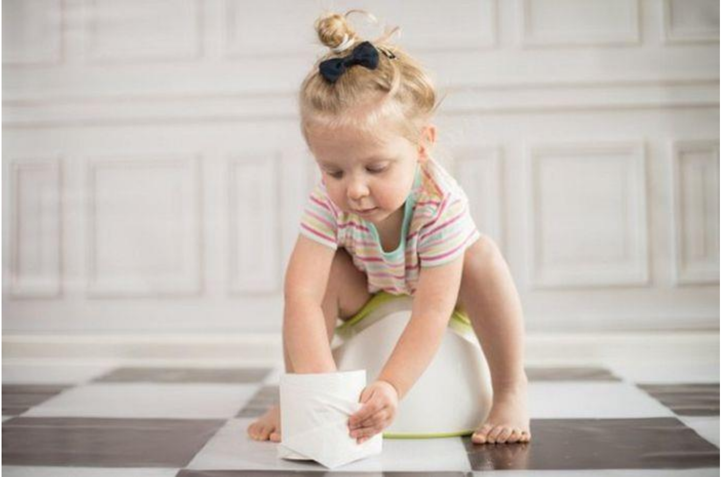
Trẻ sợ đi vệ sinh vì táo bón

Mẹ hết đau đầu vì con biếng ăn nay lại là vấn đề đi “nặng”