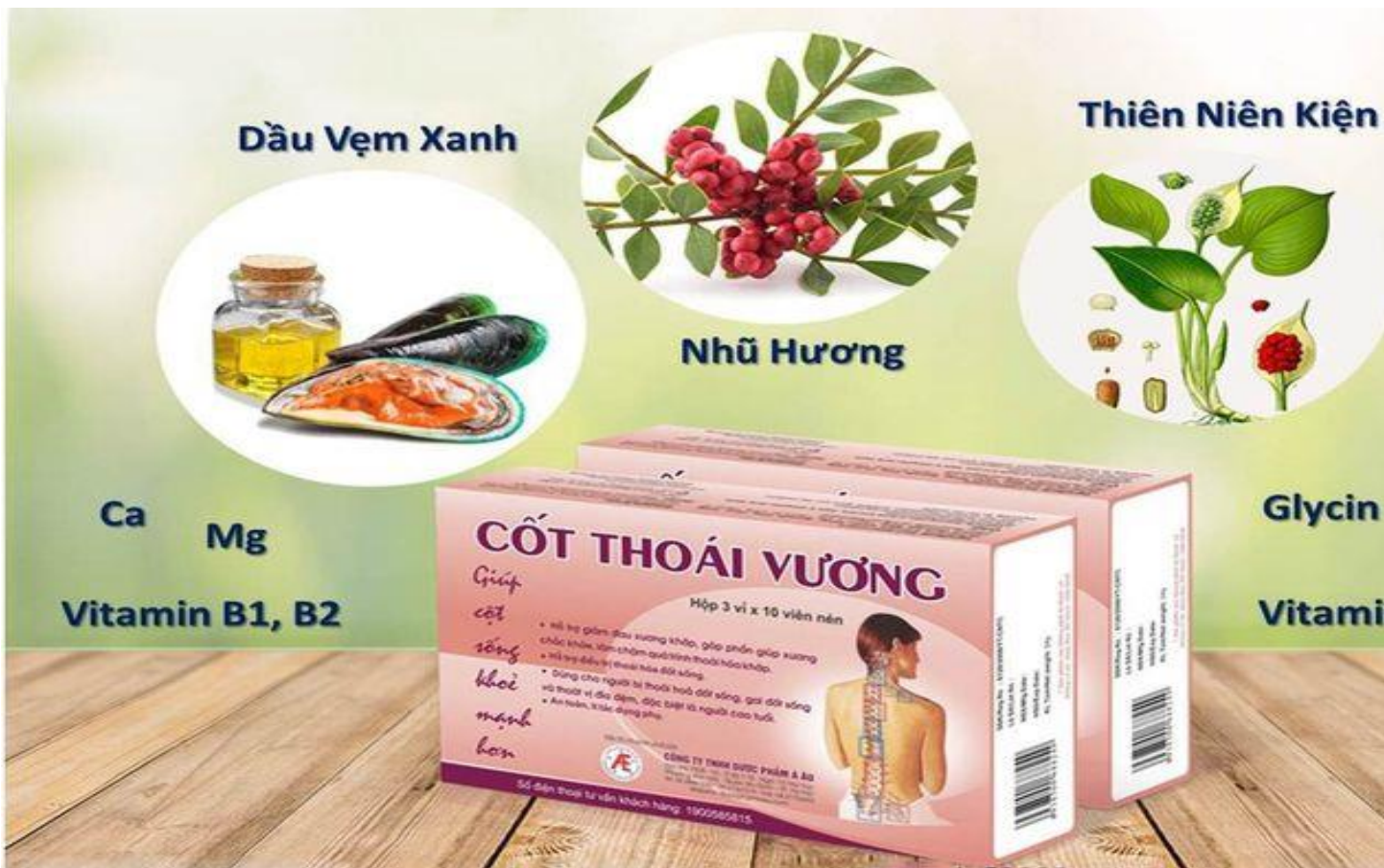
Cột Thoái Vương kết hợp thảo dược và vitamin an toàn cho sức khỏe